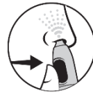
4. Tryck på knappen