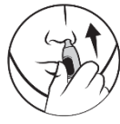
3. För in i näsan