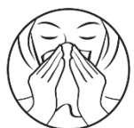
1. Snyt näsan